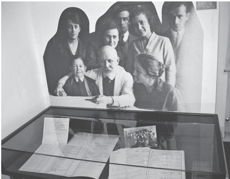
Экспонаты выставки. На фотографии — Н.П. Краснов со своими сотрудниками

верительные письма в здании, спроектированном Красновым, а затем посетил Народную скупщину — здание Правительства Сербии, также выстроенное по проекту знаменитого архитектора. Он напомнил, что к Н.П. Краснову в России обращались «Николай Петрович» и что сам зодчий по прибытии в Королевство Югославия свои проекты подписывал по-сербски — «Никола Краснов».