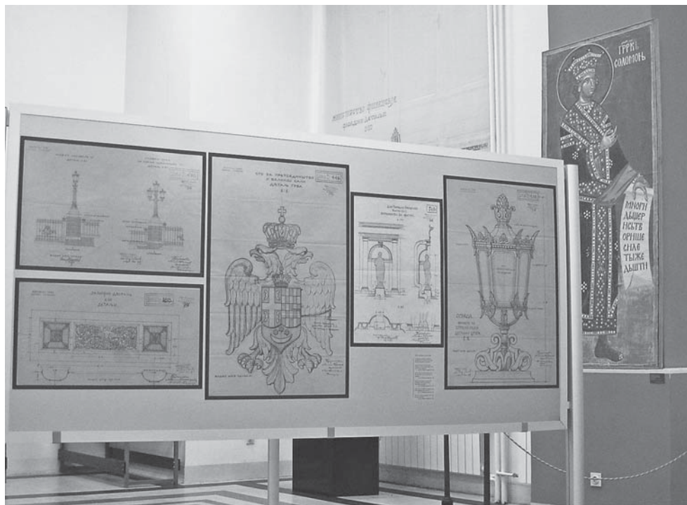
Один из планшетов выставки.