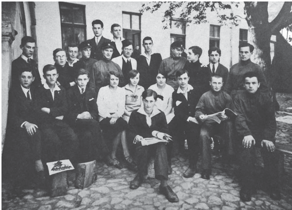
IX выпуск I Русско-сербской смешанной гимназии, Белград, 1929 г.