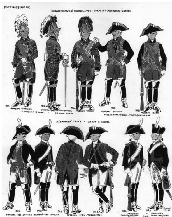
Иллюстрация из книги В.В. Звегинцова «Русская Армия. Часть 2-я. 1763–1796». Париж. 1969. Архив ДРЗ. Ф. 34. Прил. Музейное хранение. 34/6

надевшего погон родного полка, но всю жизнь прожившего под сенью его славного штандарта» 48 .